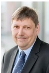
Axel Berg Westfalen und südwestliches Rheinland

Hildegard-Jadamowitz-Straße 26 10243 Berlin Tel.: +49 30 293 516 36 Mobil: +49 175 573 737 6 reinhardt@papenmeier.de