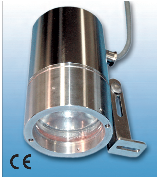
Lumiglas-Leuchte Edelstahl ESL27-Ex mit Klappscharnier-Halterung 50 W, T4