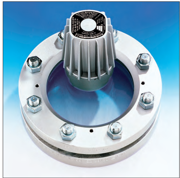
Einsatz als Kombination von Sicht- und Lichtglas auf einer Schauglas-Armatur nach DIN 28120; Montage über Klappscharnier