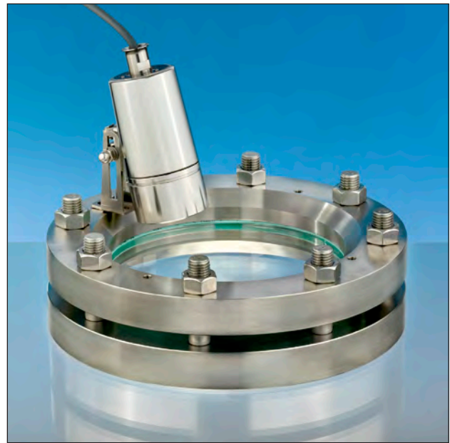
Einsatz als Kombination von Sicht- und Lichtglas auf einer Schauglas-Armatur nach DIN 28120; Montage über Klappscharnier