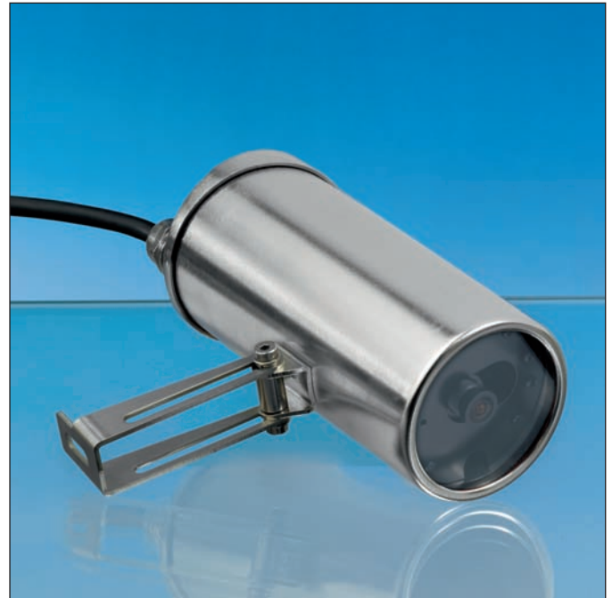
Lumiglas VISULEX Kamera mit Festobjektiv Typ K15