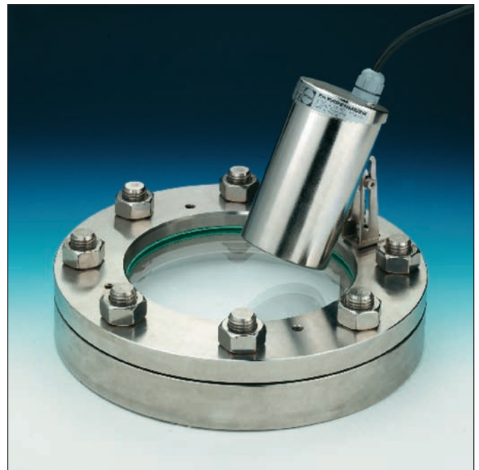
K15, montiert auf einem Flansch