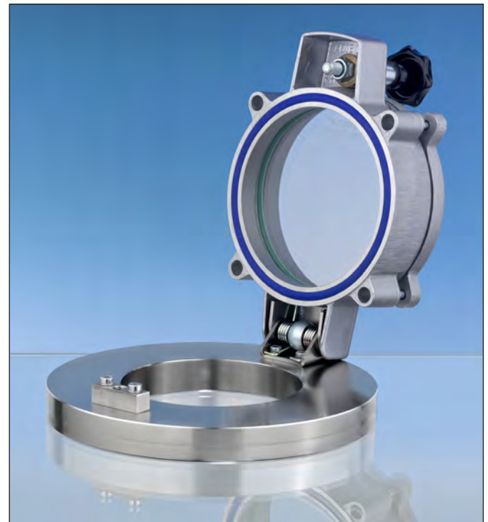
Lumiglas-Schauglas-Armatur Typ SKS