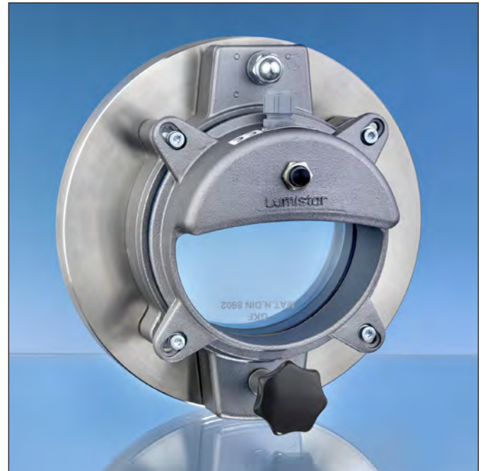
Lumiglas-Leucht-Schauglas-Armatur Typ ESKS

Die Leucht-Schauglas-Armatur muss zum Lampenwechsel geöffnet werden. Vorsicht: Vor dem Öffnen der Armatur Leuchte und Behälter außer Betrieb setzen und Behälter drucklos machen!